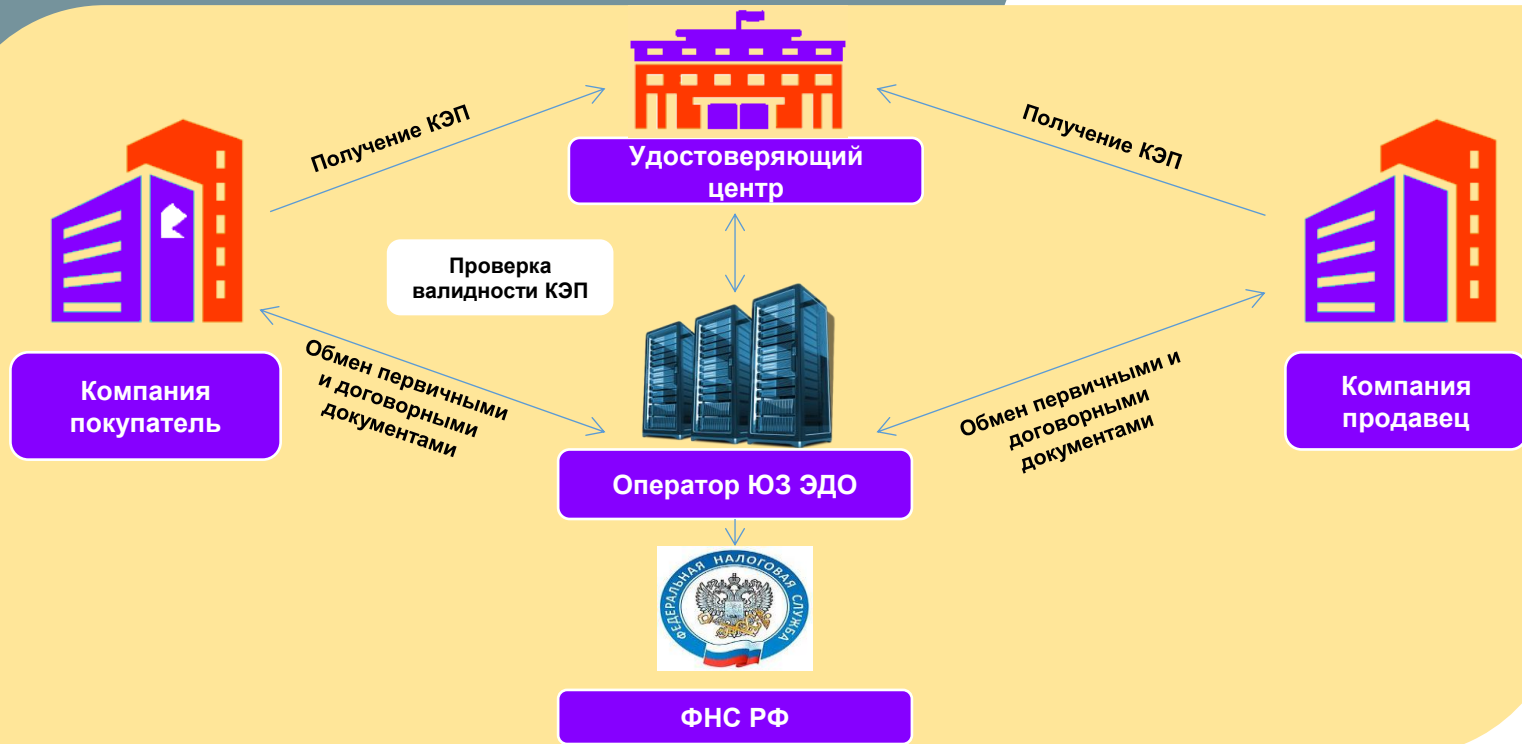
Схема взаимодействия сторон